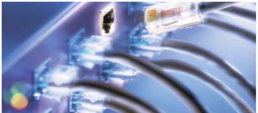
SIPlus-Anwendungen werden durch das Rechenzentrum auf den SIA-Servern bereitgestellt.

der IT-Konsolidierung beim Rechenzentrum. Das einzelne Geldinstitut ist jeweils für Installation, Betrieb, Integrität und die Umsetzung aller Auflagen verantwortlich.